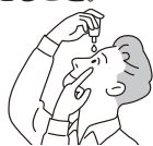
容器の先が目、まぶた、まつ毛にふれないように