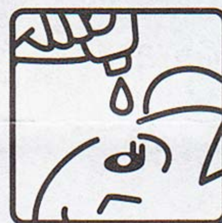
容器の先と目やまつ毛がふれることのないように