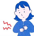
成人の乾燥性皮膚