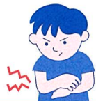
小児の乾燥性皮膚