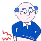
老人の乾燥性皮膚