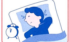
体が温まるとかゆい! (→裏面に続きます。)