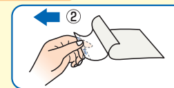
患部に貼りながら②のライナーをはがしてください