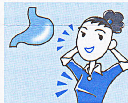
3 直接・効果的に作用します