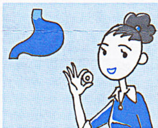
1 かみくだくと有効成分が じわじわと食道を通過して