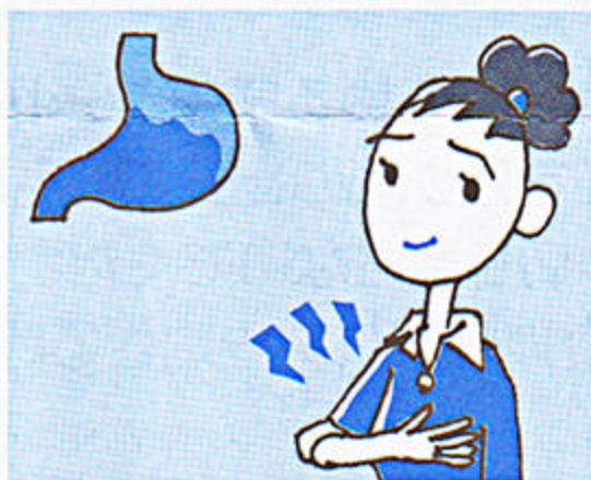
2 胸やけの原因となる胃の 上部の荒れた胃粘膜に